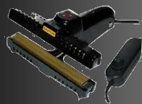
Pincettes à Souder