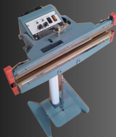
Soudeuses sur pied Thermiques ou à Impulsion