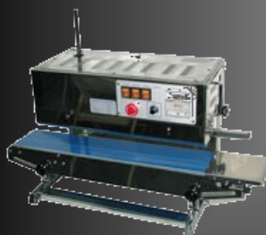
Soudeuses en Continu Horizontales et Verticales