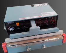
Soudeuses de Table Thermiques ou à Impulsion